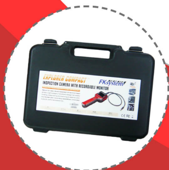
ハードケースで 簡単収納