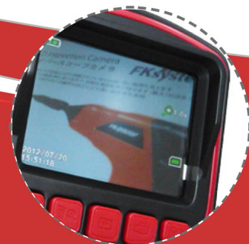
LCDモニタ 実際の画像