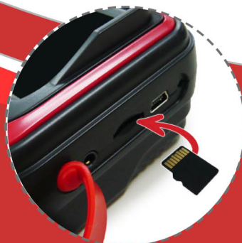
Micro SDカードへの 動画/静止画の保存